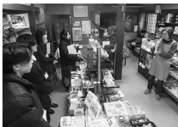
フィールドワークで店主から解説を受ける参加者（2025年12月7日、富樫ろうそく店）

く、学びの深まりと行動意欲の高まりを確認できました。何よりのやりがいは、短い一日の中で高校生の表情や言葉が変わり、帰り際に「やってみたい」と言う姿を見れたことです。企画・運営という形で若者の学びと一歩を支えられる実感は、公的な場づくりに携わる者にとって何にも代えがたい励みになります。今後は参加校の偏りや交通面などの課題にも取り組み、さらに多くの高校生が主体的に学び・活動できる場の実現を目指していきます。