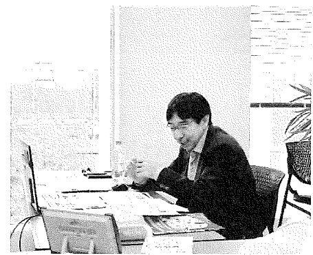
編集部の会議室で、授賞式の運営は行われた

とができた。まず投票をオンラインで簡単に投票できるアンケートフォームを利用したことで、昨年度を上回る多くの読者から投票があった。また全国からさまざまな経歴や年齢層の人たちの参加があり、結果として多様な人たちが